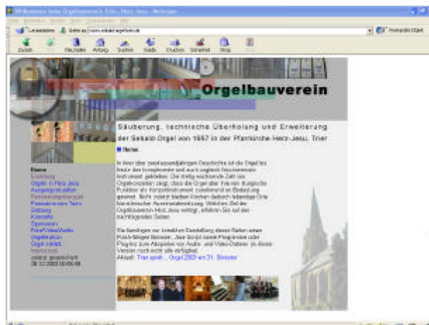
Informationen zum aktuellen Stand des Projekts finden Sie unter www.sebald-orgel-trier.de