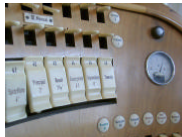
Detailaufnahme vom Spieltisch

... die Orgel einen klanglich eigenständigen Charakter hat, der sich grundlegend von den Neubauten der letzten Jahre unterscheidet und damit die Trierer Orgellandschaft bis heute ungemein bereichert.